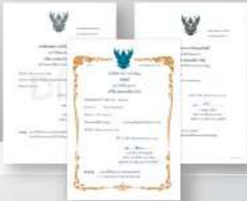
WOLF Approve, WOLF ISO License