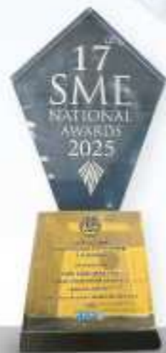
Best SME NATIONAL AWARDS (17th) Creative and design business